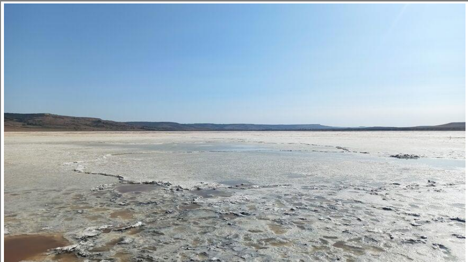
Озеро Лушниковское (Соленое озеро)